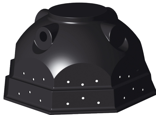
Studnia Igloo 900 l