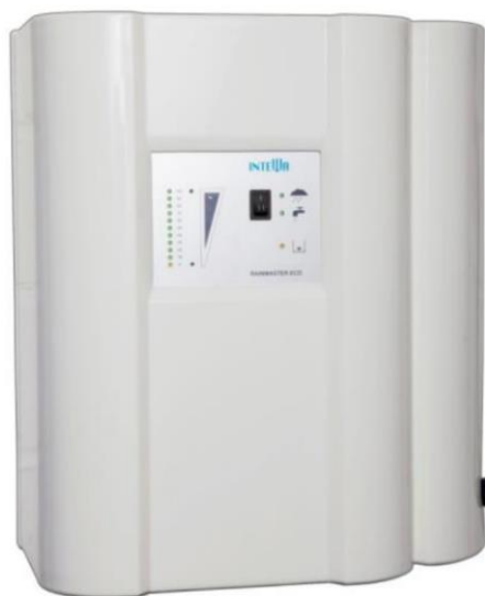
Centrala deszczowa EcoRain 10